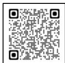
違反対象物公表制度